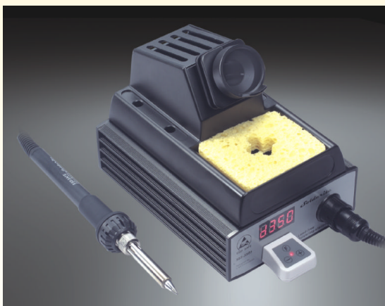
Digitale Lötstation Solderite 3505